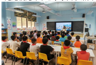
龙尾镇高明小学图书馆认知课