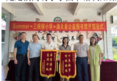
太平镇三根榕小学开馆仪式