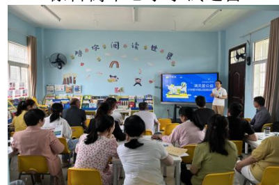
潘塘街中心小学教师认知课