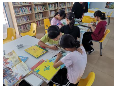
里洞镇中心小学图书加工