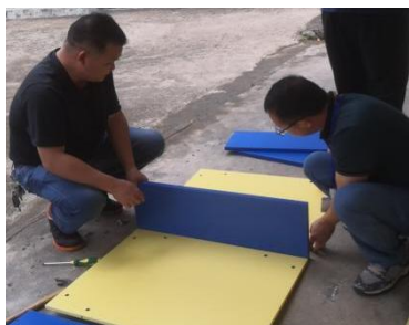
陂头镇中心小学书架组装