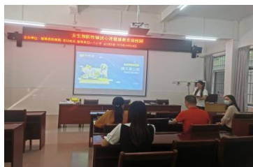
郁南县四一八小学