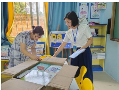
六祖镇夏卢小学图书清点验收