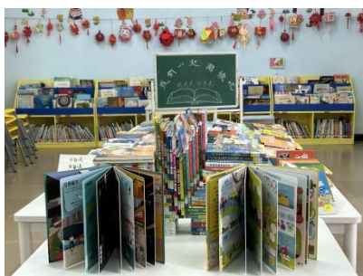
忠信镇东升小学新书展览布置