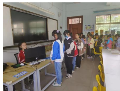
徐古街中心小学试运营