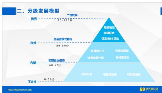
《小学图书馆运营分级方案》 分级发展模型