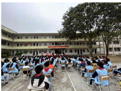
历洞镇内翰小学开馆仪式