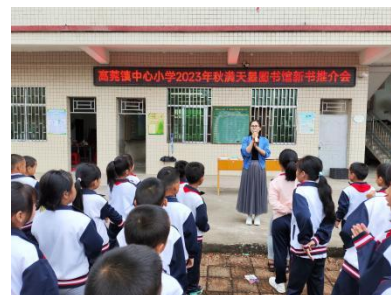
高莞镇中心小学新书宣传