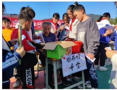
长江镇秦丽璋纪念小学 元旦阅读游园活动