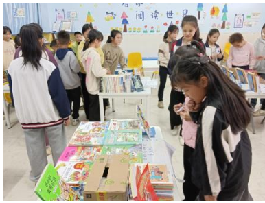
忠信镇上坐小学 六年级“一起办书展”活动