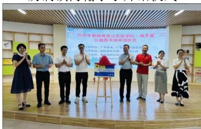
西江实验学校开馆仪式