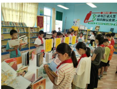
东成镇中心小学新书展览