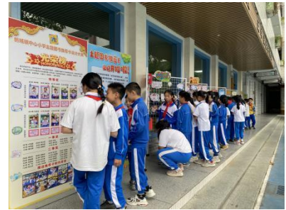
新城镇中心小学北校区 主题图书推荐卡活动