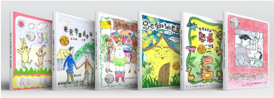
2019 春季书香校园活动·班书真书样册