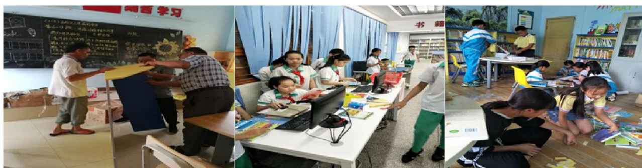
资助期图书馆升级

都城镇锦江小学由于学校图书馆管理人员更替，交接工作不到位，师生借阅量较低等原因，总体评估结果为不合格。随后，项目人员向学校发出相关改进通知及改进建议，要求学校配合整改。学校整改期间态度良好，校方积极与项目人员商讨图书馆运营工作，重新确立完善图书馆管理方式并试运行一段时间，整改情况良好。在综合考虑评估运营情况及学校提出的升级需求后，满天星公益决定在本年度为其升级 539 册图书。