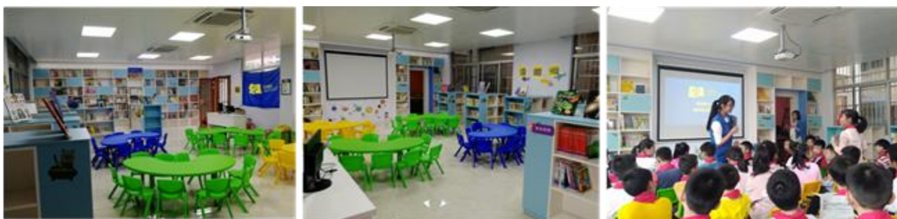
图书馆全貌及图书馆认知示范课（主校区）

学校由于教学任务较重，采取聘请外部加工人员协助图书加工与录入工作。12 月 4 日，满天星公益建馆小组成员到达学校开展实地验收，学校已基本完成图书加工及部分图书的上架整理，但发现部分图书分类错误，录入出错等问题。项目人员将分类有问题的图书挑出并重新加工并完成分类上架的工作。图书验收工作完毕后，项目人员协助开展图书馆美化工作。6 日，项目人员组织校长及老师们到图书馆内观摩图书馆认知课程，并协助馆长老师对学生管理员进行培训，方便日后的运营可以顺利进行。