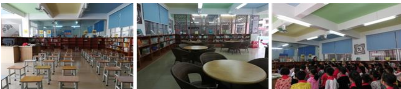
图书馆全貌及管理培训课（分校区）