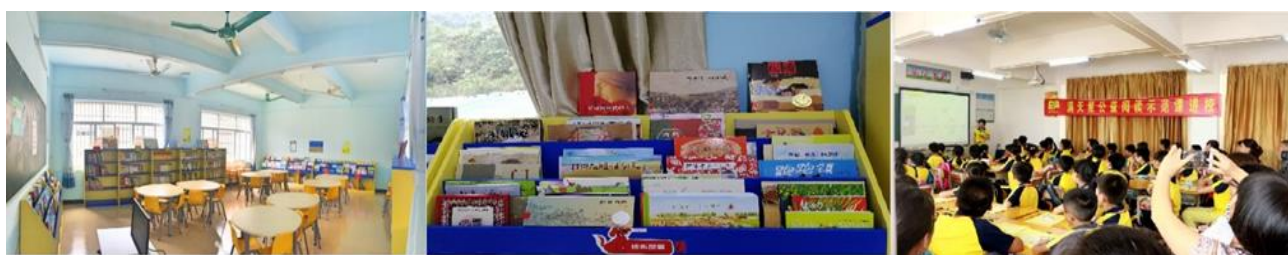
满天星公益儿童推广项目（左：簕竹镇中心小学图书馆 中：图书 右：阅读示范课现场）

目前有两种公益图书馆类型，分别是与乡村小学合作建设的小学图书馆（简称小学馆）以及与乡村社区或流动人口社区组织合作的社区图书馆（简称社区馆）。图书馆合作模式有两种：普通馆、共建馆。普通馆是指满天星公益全资建设公益图书馆；共建馆是指由满天星公益与项目点共同出资建设示范性图书馆，共建模式除了资金外，更侧重在项目发展层面上：共同打造示范性阅读氛围示范校、小学阅读课程开发和应用、种子教师阅读推广培训、阅读活动开展与支持，旨在县域阅读推广层面能起到更大的带动和示范作用。