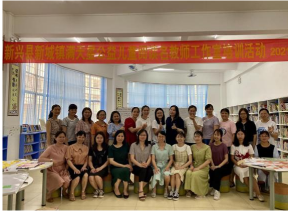
支持学校发展“绘本阅读”特色教学。