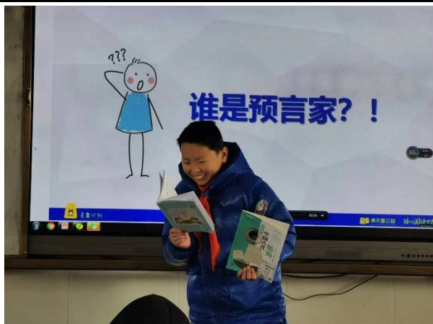
右图-学生分享阅读宝藏填写内容