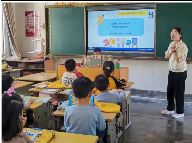
左图-班级开展阅读交换活动