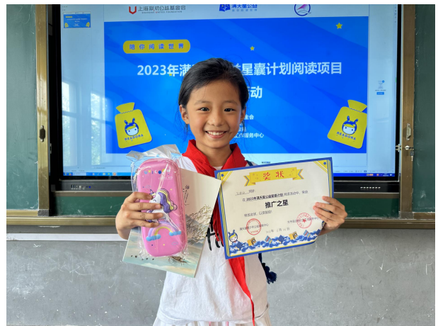
右图-学生获得阅读表彰