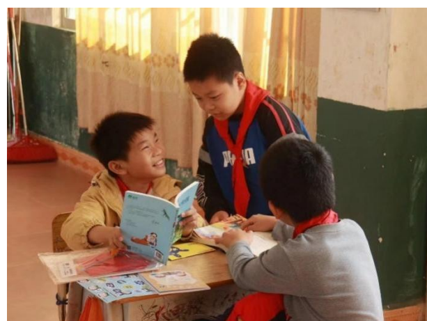
右图-学生共同阅读交流