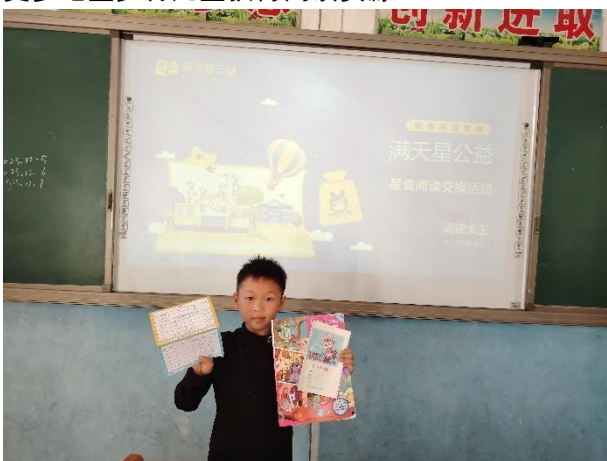
左图-学生分享阅读存折记录

目前项目的周期性明确，采取制定统一时间节点来统筹推动项目整体流程，对于招募评审和具体派发、开展阅读活动及表彰活动等时间节点限制性较大，主要受项目人手规模存在跟进上限、供应商备货时间较长等因素限制，在实际项目推动过程中，存在周期外捐赠方或合适合作机构的新需求难以回应的情况，影响项目进一步拓宽受益规模。在确保项目执行成效的基础上，项目团队需拆解限制因素和探索降低影响的方式，提升项目周期的灵活度，增加一定的时间自由度，更进一步发挥项目轻量化和标准化的优势，支持更多地区乡村儿童获得阅读资源。