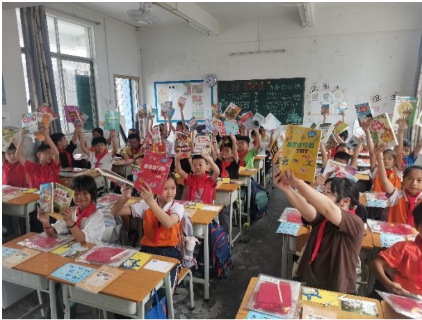
左图-学生展示阅读包内丰富图书

规模村校打造书香校园》推文，分析如何运用星囊资源打造书香校园，并积极转发各校在开展活动过程中的美篇与推文，促进各校间的经验学习与分享。