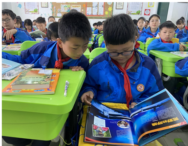
右图-学生在一起阅读星囊图书