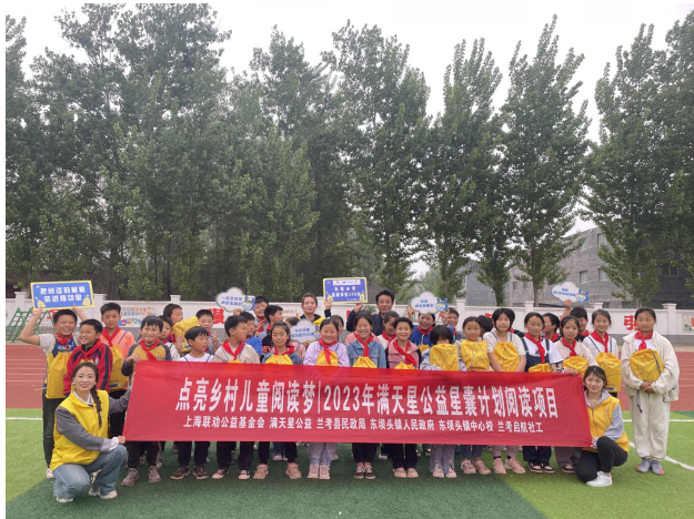
左图-开展星囊派发活动